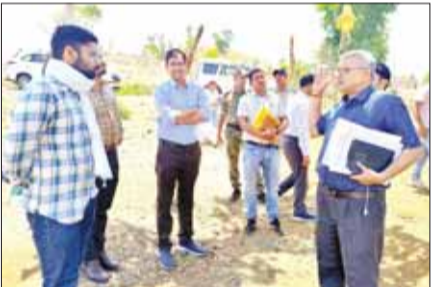
कलेक्टर ने कार्यों को जल्द से जल्द पूरा करने के लिए निर्देश अनूपपुर।

कार्य का निरीक्षण किया। इस दौरान कलेक्टर ने विद्युत विभाग के अधिकारियों को विद्युतीकरण कार्य जल्द से जल्द पूर्ण कर ग्रामीणों को विद्युत की बेहतर सुविधा मुहैया कराने के निर्देश दिए। इस दौरान कलेक्टर ने विद्युत खंभे, तार इत्यादि के संबंध में भी संबंधित अधिकारी से जानकारी प्राप्त की।